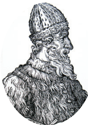
Великий князь Иван III

До XVIII века чиновники на Руси жили благодаря так называемым «кормлениям», то есть, при отсутствии оклада за исправление должности, разрешению на подношения от заинтересованных в их деятельности лиц. Одаривали их не только деньгами, но и «натурой» — мясом, рыбой, пирогами и пр., что было делом обыкновенным.