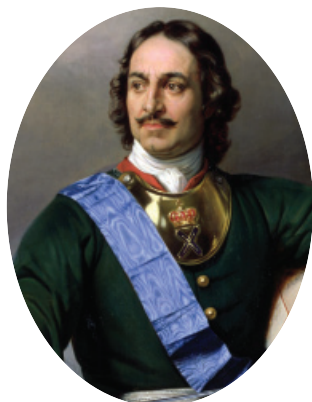
Император Петр I

Сообщениями «о похищении казны» первоначально занималась тайная канцелярия во главе с графом П.А. Толстым. И работала она на совесть. Но были и такие дворяне и чиновники, которые к проблеме мздоимства относились гораздо терпимее. По рассказам современников, однажды в Сенате Петр пригрозил издать указ, по которому всякий, кто украдет у казны сумму, на которую можно купить веревку, будет повешен. Генерал-прокурор Ягужинский на это заметил: «Неужели вы хотите остаться императором без служителей и подданных? Мы все воруют — с тем только различием, что один больше и приметнее, чем другой».