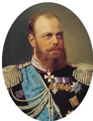
Император Александр III