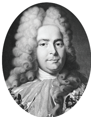
Генерал-прокурор Павел Иванович Ягужинский