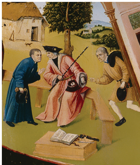
Фрагмент «Алчность» картины Иеронима Босха «Семь смертных грехов»

Рассматривая участников коррупции на примере взяточничества, стоит отметить, что в коррупционном процессе всегда участвуют две стороны. Одна сторона — это взяткополучатель (подкупаемый). Вторая сторона — это взяткодатель (осуществляющий подкуп). Также в процессе может участвовать и третья сторона — посредник.