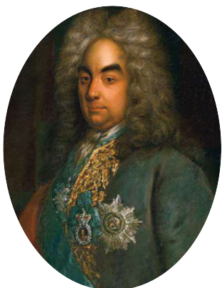
Петр Андреевич Толстой